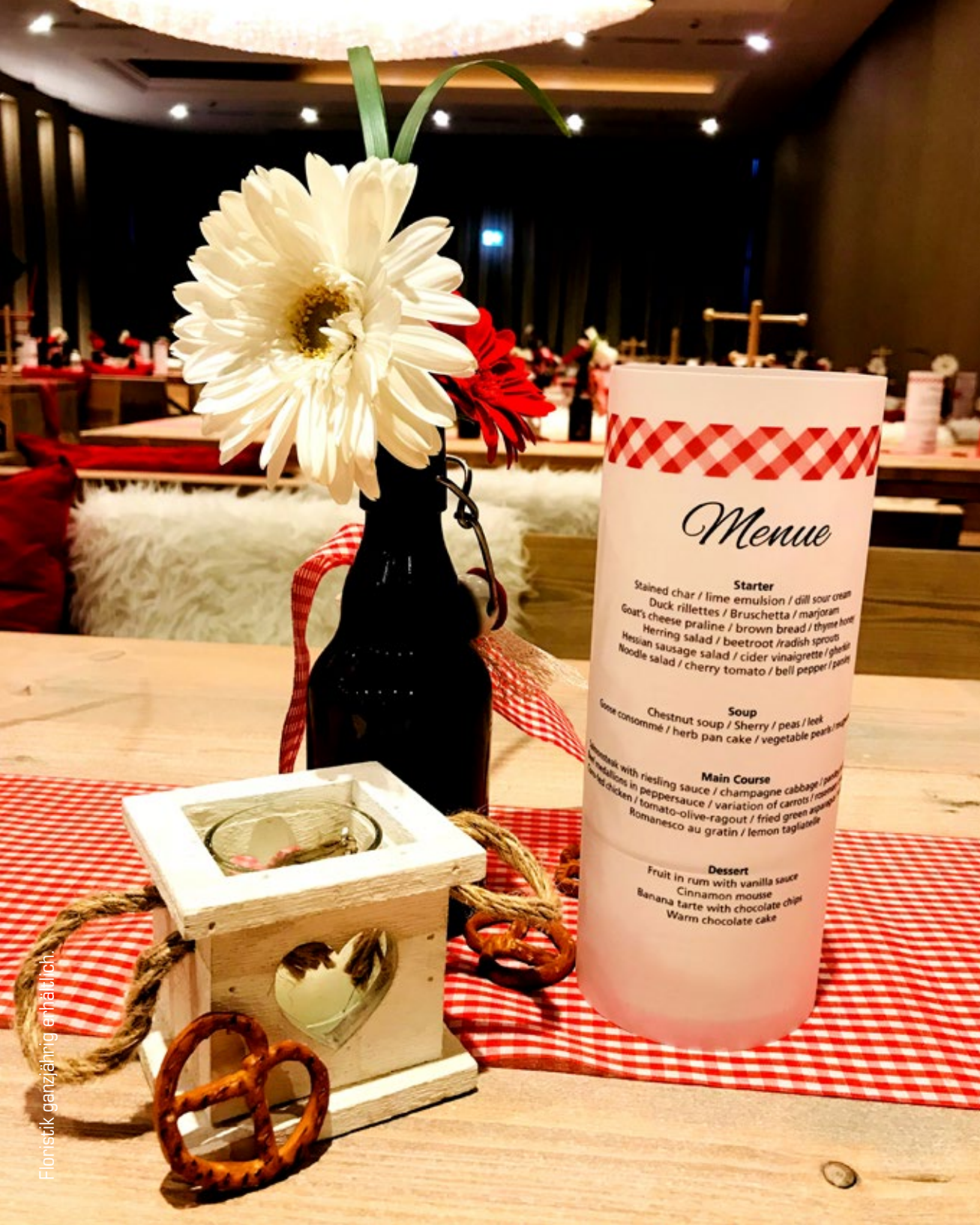
Floristik ganzjährig erhältlich.

Menue Starter Stained char / lime emulsion / dill sour cream Duck rillettes / Bruschetta / marjoram Goat's cheese praline / brown bread / thyme honey Herring salad / beetroot / radish sprouts Hessian sausage salad / cider vinaigrette / gherkin Noodle salad / cherry tomato / bell pepper / parsley Soup Goose consommé / herb pan cake / vegetable pearls / leek Chestnut soup / Sherry / peas / leek Main Course Venison steak with riesling sauce / champagne cabbage / potato gratin Duck rillettes in peppercorn sauce / variation of carrots / roasted potatoes Roast chicken / tomato-olive-ragout / fried green asparagus Romanesco au gratin / lemon tagliatelle Dessert Fruit in rum with vanilla sauce Cinnamon mousse Banana tarte with chocolate chips Warm chocolate cake