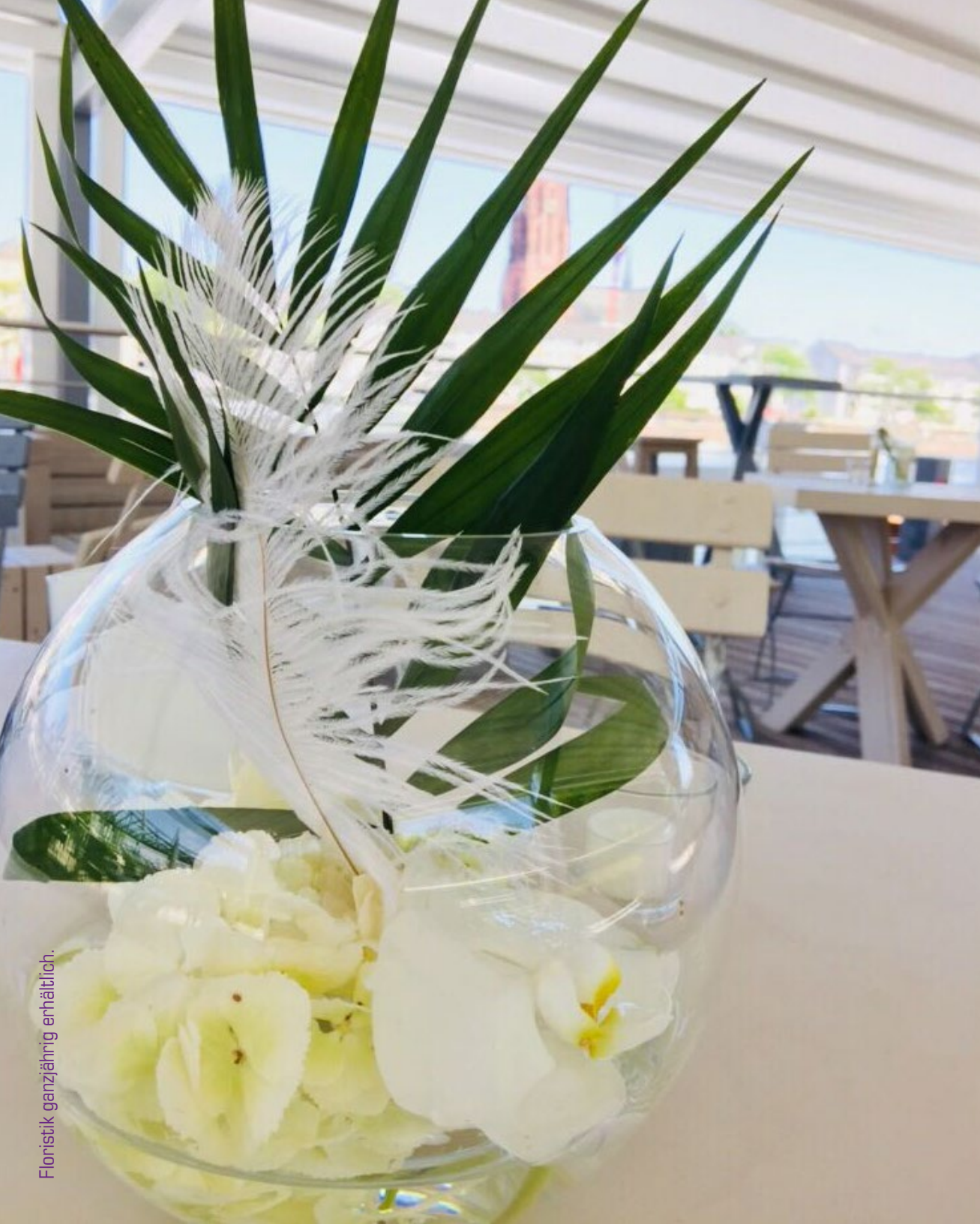
Floristik ganzjährig erhältlich.