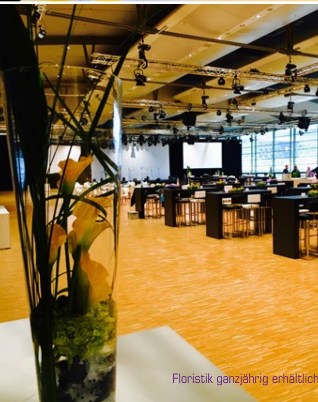
Floristik ganzjährig erhältlich (alle Abbildungen).