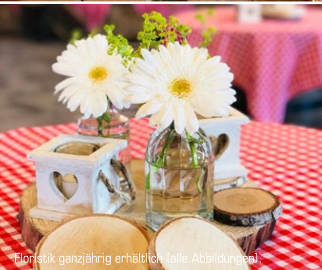
Floristik ganzjährig erhältlich (alle Abbildungen).